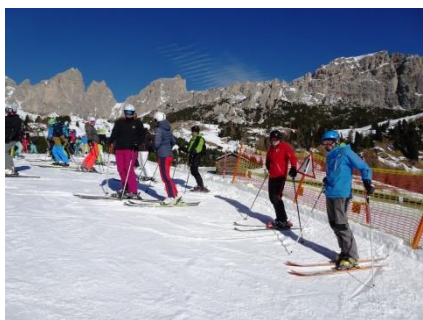
Links: am Grödner Joch rechts: am Boe Lift mit der Marmolata im Hintergrund