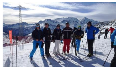
unten: Mittagspause am Passo Campolongo im Restaurant La Tamba