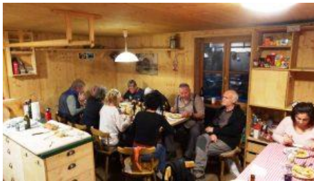
links: allen scheint es zu munden